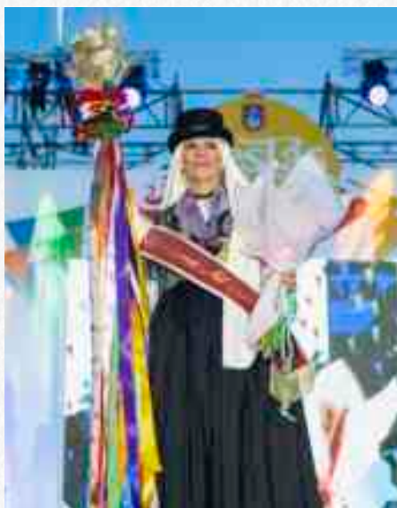
NELLY CARMEN GARCÍA MENDOZA ROMERA MAYOR 2025