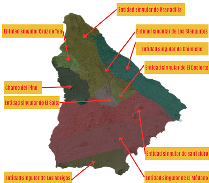
Mapa 1: Mapa del municipio de Granadilla de Abona con sus diez entidades singulares. Elaboración propia con datos de Grafcan.

El municipio de Granadilla de Abona se compone de diez entidades singulares (Granadilla de Abona, Chimiche, Cruz de Tea, Charco del Pino, Los Blancitos, El Desierto, El Salto, San Isidro, El Médano y Los Abrigos). Una entidad singular es cualquier área habitable del término municipal, habitada o excepcionalmente deshabitada, claramente diferenciada dentro del mismo, y que es conocida por una denominación específica que la identifica sin posibilidad de confusión(7). Sin embargo, las unidades más importantes de análisis son los núcleos poblacionales, los cuales constituyen unidades mucho más pequeñas y contenidas por las entidades singulares. En base a ello, los recursos comunitarios para la salud se concentran principalmente en dos núcleos. Se trata de San Isidro y Granadilla, con 23 y 19 recursos mapeados respectivamente. Mientras San Isidro destaca como sede de los recursos asociativos y del tercer sector, Granadilla lo hace como sede de los institucionales, sobre todo de las áreas y concejalías del Ayuntamiento de Granadilla de Abona.